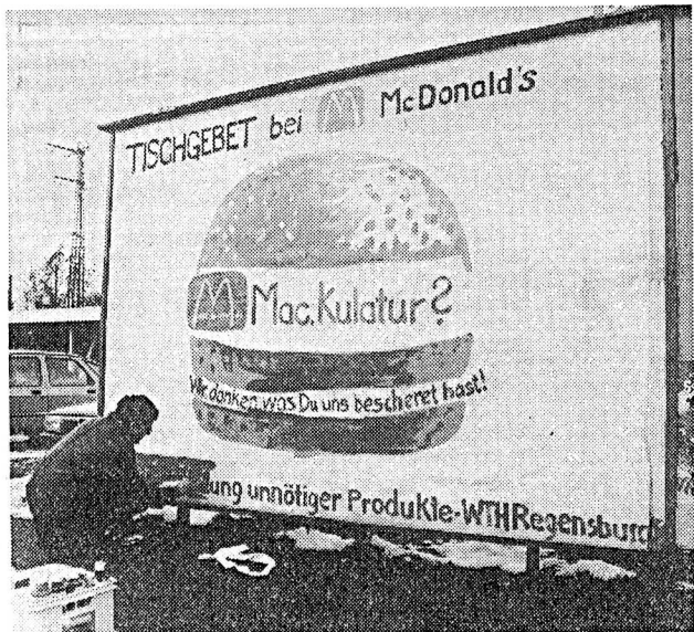
WTH Regensburgers „Tischgebet“ wurde zweimal von Unbekannten überklebt.